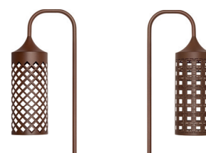
1 - Lotus